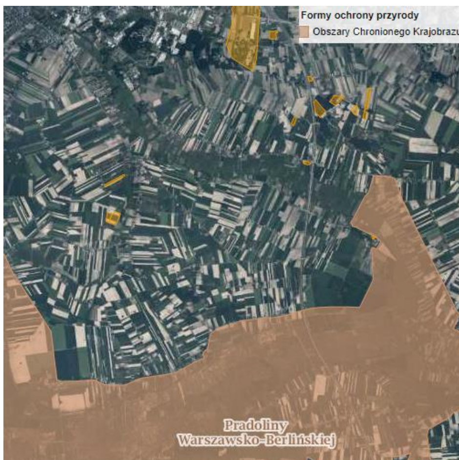
Położenie analizowanych obszarów względem obszarów ochrony przyrody