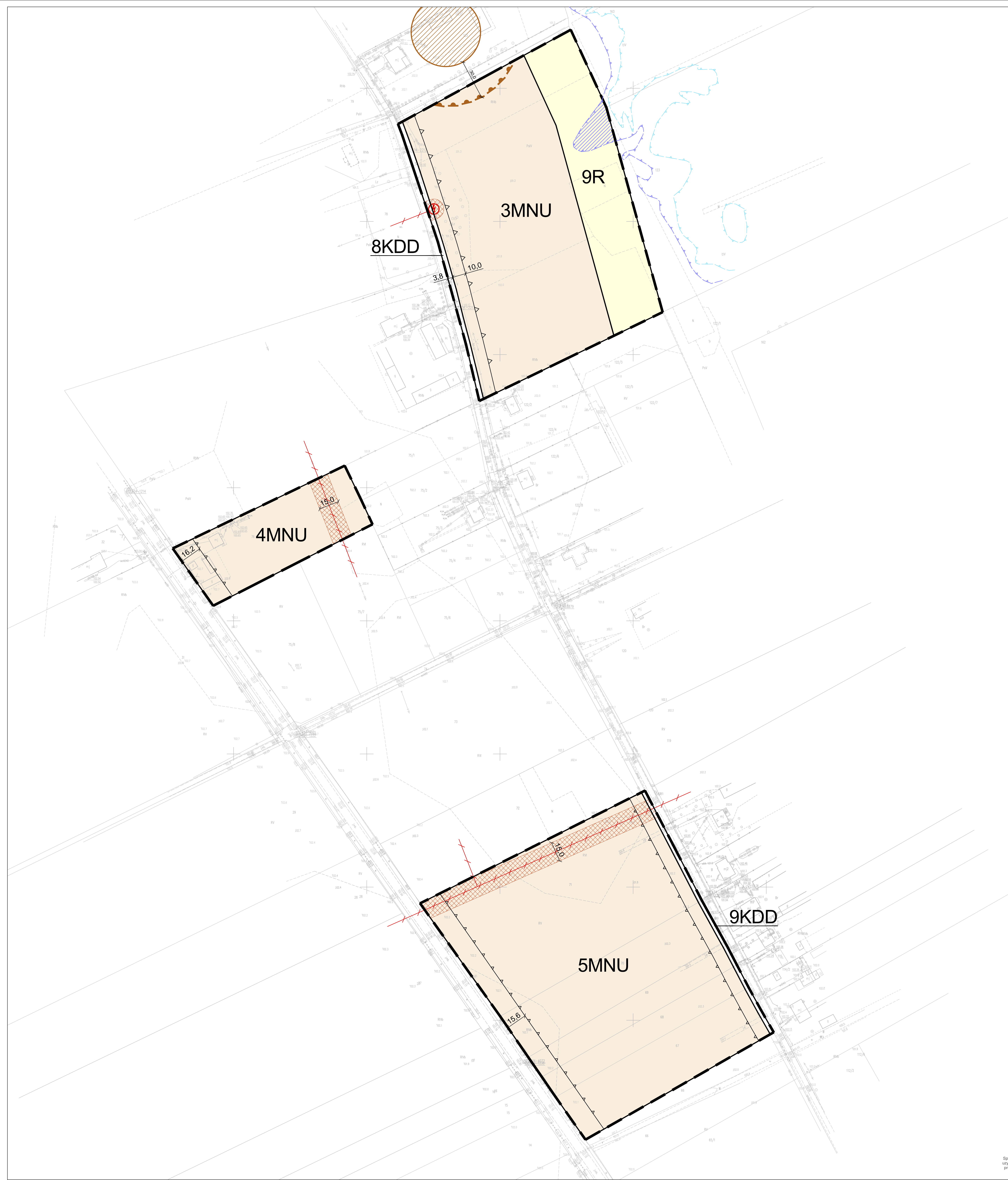
WYRYS ZE ZMIANY STUDIUM UWARUNKOWAŃ I KIERUNKÓW ZAGOSPODAROWANIA PRZESTRZENNEGO GMINY KRZYŻANÓW, DLA CZĘŚCI OBSZARU MIEJSCOWOŚCI SOKÓŁ, ORAZ CZĘŚCI OBSZARU MIEJSCOWOŚCI KASZEWY DWORNE, PRZYJĘTEJ UCHWAŁĄ NR 28154/2016 RADY GMINY KRZYŻANÓW Z DNIA 27 WRZEŚNIA 2016 R.