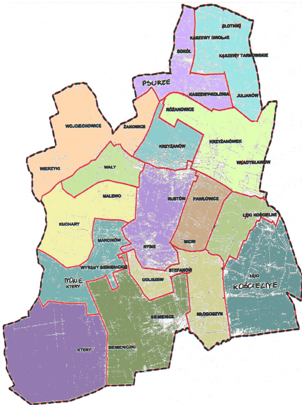
Mapka podziału Gminy Krzyżanów na okręgi wyborcze